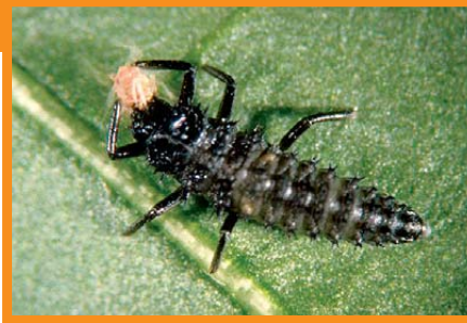
Larve de coccinelle dévorant un puceron