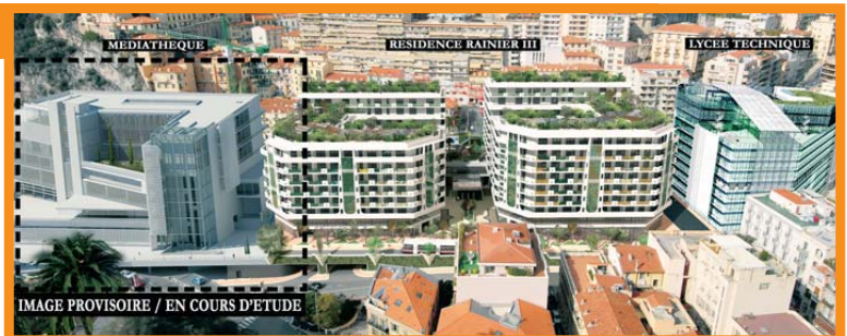
lots Canton, Rainier III et Prince Pierre

des travaux s'intéressera à partir du 11 décembre au côté mer de la Place du Canton avec la réalisation de micropieux et du complément de dalle. Afin de répondre aux exigences de sécurité et de poursuivre le planning des travaux, un plan de circulation adapté au chantier sera mis en œuvre. Parallèlement, en surface, les terrassements ont commencé pour la réalisation de la Médiathèque (îlot Canton), des logements domaniaux (îlot Rainier III) et du lycée technique (îlot Prince Pierre). Cela se voit... et cela s'entend. Quasiment tous